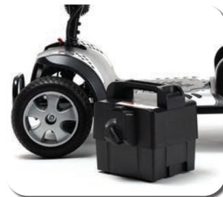
Batterie verrouillable et amovible