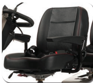
Confortable deux places avec ceintures de sécurité et accoudoirs réglables

La base est similaire au Carpo 2 mais en version deux personnes. Idéal pour sortir ou faire du shopping ensemble. Deux sièges luxueux, réglables et confortables avec ceintures et suspension flexible garantissent un plaisir de conduite merveilleux et sûr.