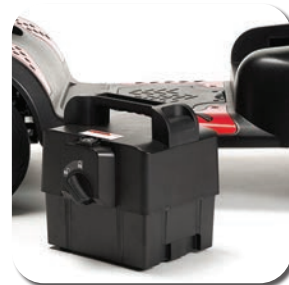
Batterie amovible pratique