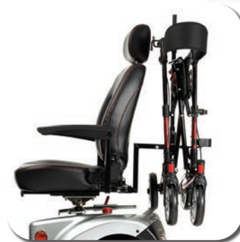
SW (SH) 06 - Porte rollator