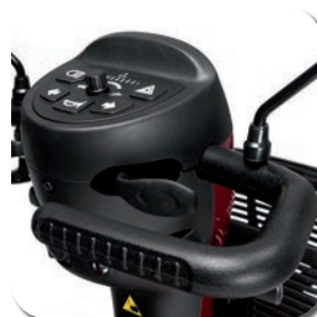
Poignées en U (guidon Delta)

Commande manuelle avec pictogrammes clairs, éclairage LED, élégant pare-chocs de sécurité sportif et vitesse de pointe jusqu'à 15 km/h.