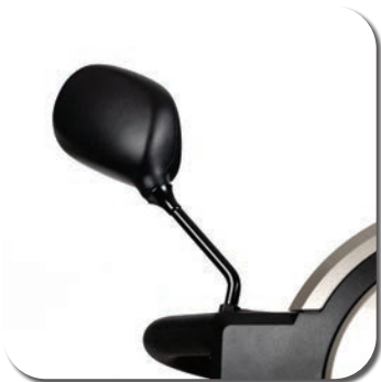
SH74 - SW74 - Rétroviseur (par pièce)