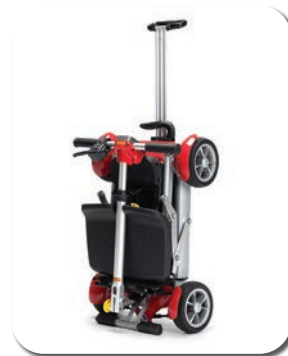
Poignée de transport en option