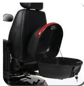
Coffre de rangement en option avec serrure

Ce scooter vous offre le plaisir de conduire ultime.