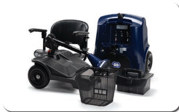
Démontage facile pour le transport