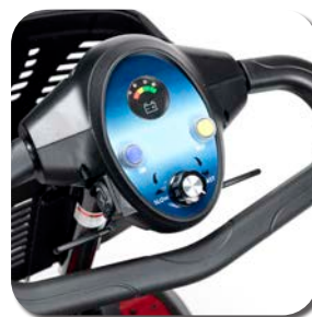
Finition colorée et usage facile

Le Venus 4 Sport (version pneumatique) est un scooter à quatre roues pour une utilisation intérieure et extérieure. Le guidon delta et les pneus procurent un plaisir de conduite supplémentaire. Tout comme le Venus 4 Sport de série, ce scooter compact peut également être démonté en 4 parties sans avoir besoin d'outils supplémentaires.