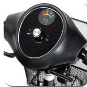
Commande facile à utiliser avec une clé détachable