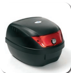
Coffre de rangement en option avec serrure

Le Carpo 3D est un scooter à trois roues puissant et confortable pour l'extérieur. Ce scooter est programmable électroniquement et est livré en standard avec une commande à contraste élevé avec compteur kilométrique. Plaisir de conduite ultime garanti.