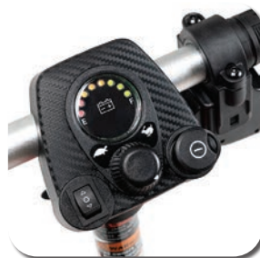
Indication claire du niveau de charge