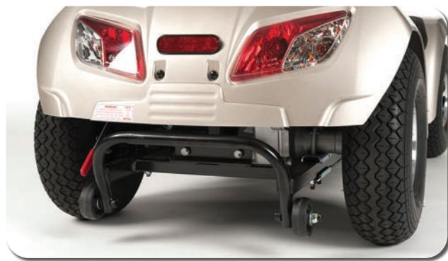
Conception simplifiée mettant l'accent sur la visibilité et la sécurité