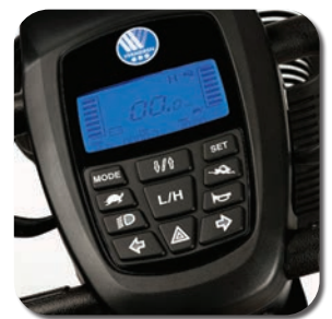
Contrôles clairs et simples