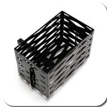
SW83 - Support de réservoir d'oxygène (sur mesure)