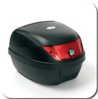
SW03 - Top case