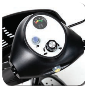
Commandes faciles à utiliser

Le Venus 4 Sport est un scooter à quatre roues pour une utilisation intérieure et extérieure. Confortable et très pratique pour une utilisation en intérieur et le transport. Peut être démonté en 4 parties sans avoir besoin d'outils.