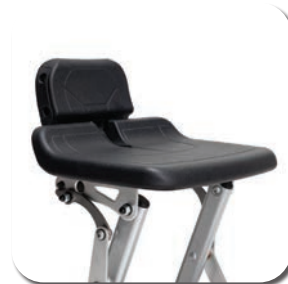
Support lombaire en option