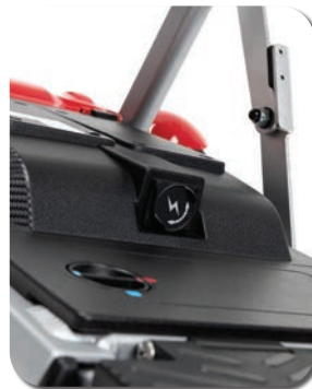
Accès facile à la batterie