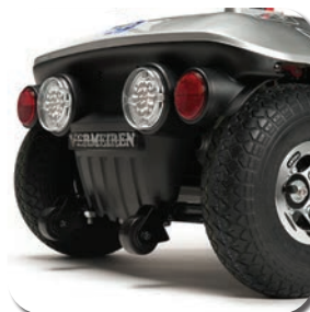
Design moderne et anti-basculement