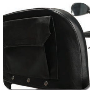
Sac de rangement à l'arrière du siège