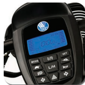
Contrôles clairs et simples