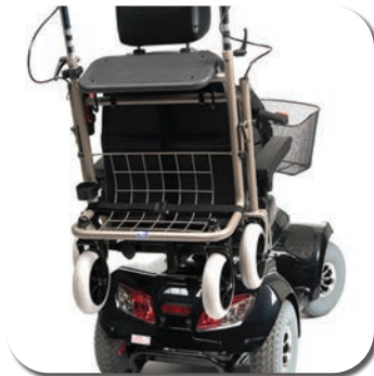
SW (SH) 06 - Porte rollator