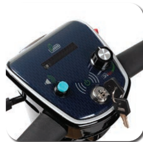
Commande facile à utiliser avec clé détachable