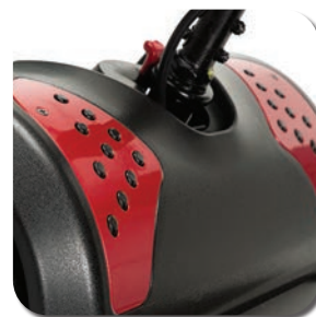
Motif antidérapant élégant pour les pieds