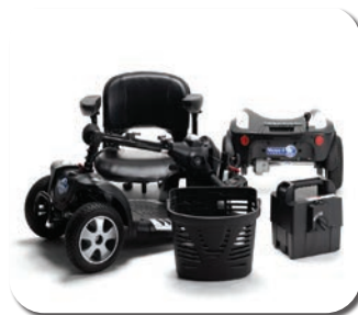
Scooter intérieur pliable à 4 roues