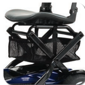
Sac pour les courses