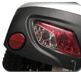
Visibilité de jour comme de nuit

Le Carpo 2 SE (Special Edition) est un scooter à quatre roues complètement nouveau et contemporain pour une utilisation quotidienne avec tout le confort nécessaire.