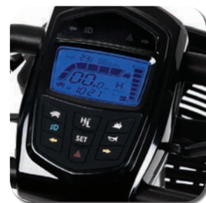
Contrôles clairs et simples