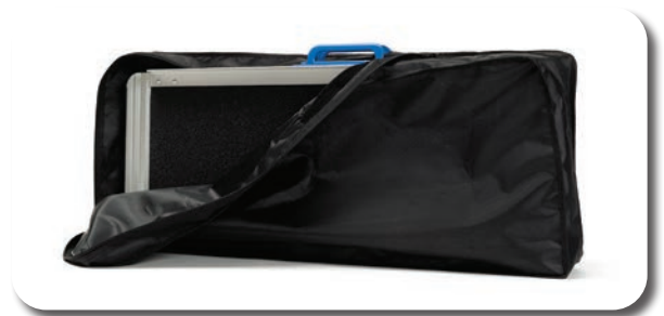
Compris sacs de rangement et un set contient deux rampes

Placer un scooter ou un fauteuil roulant dans la voiture devient facile grâce aux rampes. Ces rampes pliables vous permettent de placer en toute sécurité des scooters et des fauteuils roulants lourds dans la voiture.