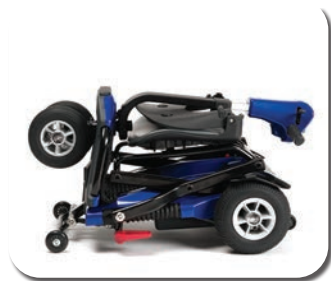
ÉTAPE 3 - FAIT