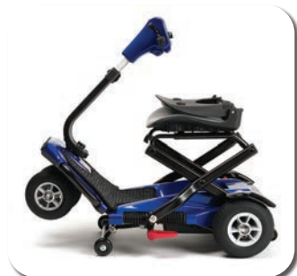
ÉTAPE 2 - PLIAGE