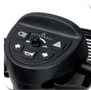
Commande manuelle avec pictogrammes clairs