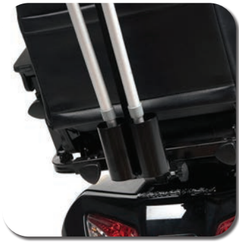
SW (SH) B31 - Porte béquille