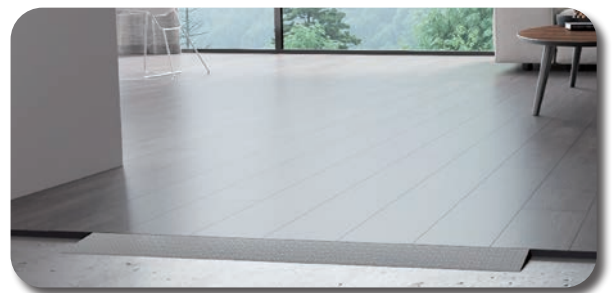
Facile à installer et à ranger à nouveau

Disponible en 4 hauteurs différentes : 10 mm, 12 mm, 14 mm et 16 mm et en polyéthylène résistant.