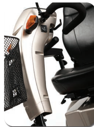
Colonne de direction élégante et réglable