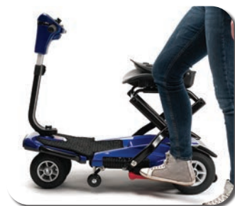
ÉTAPE 1 - PIED SUR LA PÉDALE