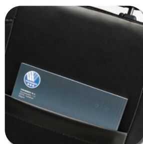
Sac de rangement à l'arrière