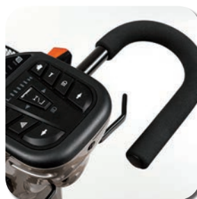
Poignées en U (guidon Delta)