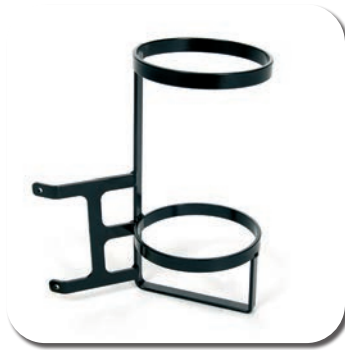
B83 - Porte-obus