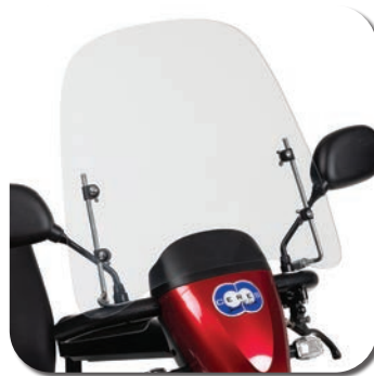
SW09 - Pare-brise (Carpo & Ceres SE)