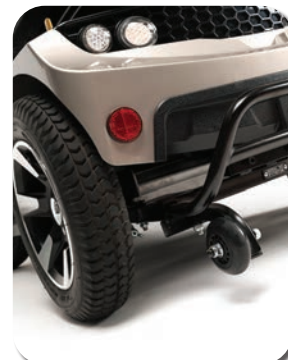
Eclairage LED arrière et avant