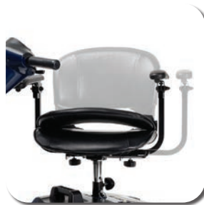
Siège pivotant / rabattable et accoudoirs réglables / rabattables