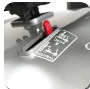
Réglage facile de la roue libre du moteur